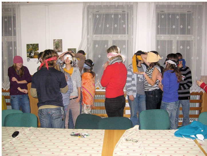
Úvodní hrátka - řazení poslepu podle velikosti

Chápeme, že každý oddíl je v jistém stylu jiný a metody k dosažení stejných cílů jsou různé. Na kurzech nevnucujeme mladým vedoucím myšlenku, že naše cesta kterou prezentujeme je jediná správná (snad s výjimkou jistých pasáží bezpečnosti práce a první pomoci), ale že k „ideálnímu“ oddílu vede mnoho cest. Z níže uvedených reakcí účastníků sami uvidíte, že mnozí jsou překvapeni jak rozdílný je styl ve vedení oddílů ze kterých pocházejí. Hlavním účelem vstupních kvalifikací je nasměrování mladých lidí na cestu budoucích vedoucích, nabídnutí řešení různých situací, předání zkušeností, které nelze vyčíst z knih a podání důkazu že v tom nejsou sami. Zda z nich vyrostou kvalitní oddíloví vedoucí je už na nich samotných a na podmínkách oddílů, ve kterých vyrůstají.