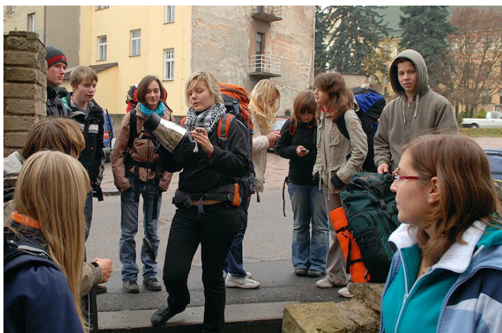
Hlavní talisman Výzvy 2009

Jak by řekl klasik, co říci závěrem? Z pohledu lektorů dopadla Výzva 2009 dobře, máme celou řadu poznatků a námětů na příště, víme co jsme zapomněli a co jsme možná probírali zbytečně podrobně. Žádná Výzva není stejná a vždy záleží na složení účastníků, jejich znalostech, náladě, oddílech ze kterých přicházejí, zkrátka každý