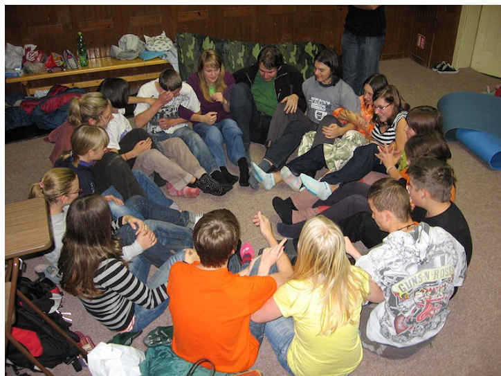
Hra - blokáda kytiček před zlou stavební firmou

Dostalo se postupně na všechny obory od těch kde k úspěchu vede většinou jen jedna cesta jako je první pomoc a bezpečnost, přes pedagogiku a psychologii, metodiku k čistě pragmatickému a exaktnímu hospodaření, které je nutné hlavně z důvodu aby nám „pes“ hospodář zaplatil utracené peníze za věci do oddílu.