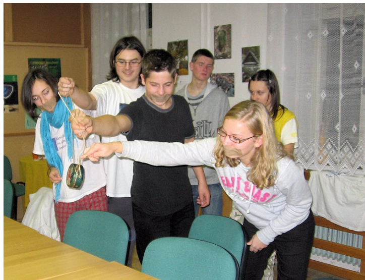
Přesun potravin do Afriky

Dopolední program vyplňujeme psychologií a pedagogikou, kde se diskuze dostává do víru zejména v otázkách nefyzických rozdílů mezi pohlavími, zbytek času pak vyplňuje první pomoc ve své teoretické části. Po menší venkovní hratce, která ne zcela splnila očekávání zadavatelů došlo na várky dalších informací z oblastí bezpečnost, pedagogika a psychologie. Zejména nácvik praktických situací jako nástup dětí do vlaku, si někteří velmi užívali. Večer přišla na pořad dne i nejlepší hra vymyšlená účastníky a to humanitární pomoc do Afriky.